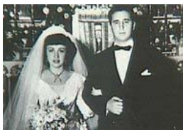
Su primer matrimonio a finales de 1948