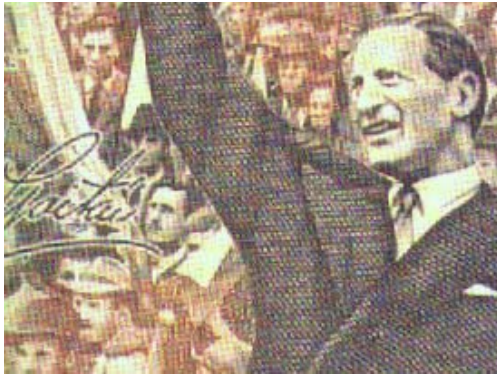
Fidel Castro, febrero de 1948

LA ÚLTIMA PALABRA LA TIENE EL ARTISTA DISEÑADOR DEL BILLETE Y SU INTERPRETACIÓN DE LAS FOTOGRAFÍAS UTILIZADAS